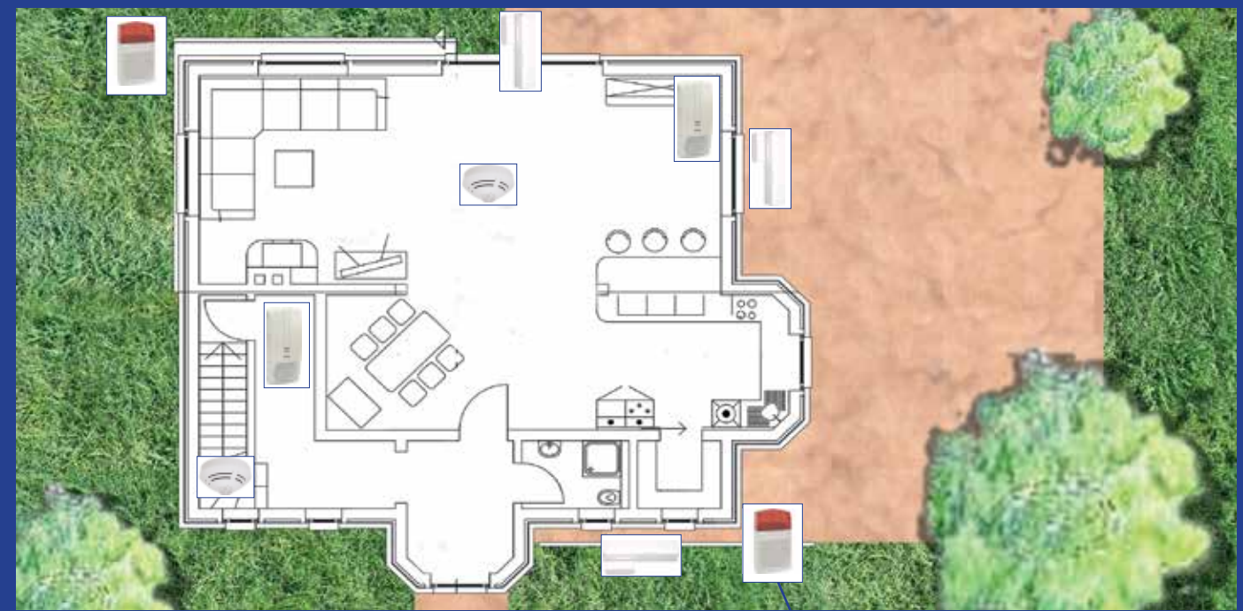
Bewegungsmelder Magnetkontakt Alarmgeber Technische Melder